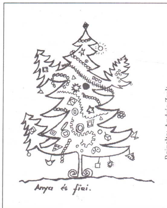
Rajzolta: András Zsolt

Ezekkel a gondolatokkal kívánok minden lövétei családnak és egyénnek, akár itthon él, akár már elszármazott, de gyermekkori szép emlékei ide kötik, kegyelmekben gazdag Karácsonyi Ünnepeket és boldog, békés Új Esztendőt!