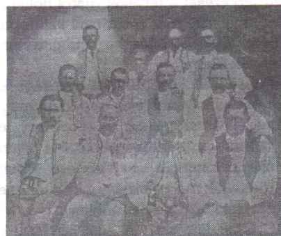
Lövéte egykori előjárói