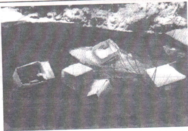
Mi marad az ünnepekből?

Én egy nagyon „látványos” maradványát találtam 2000. jan. 3-án a szilveszteri mulatságnak a Kis-Homoród partján sétálva, az épülő ülepítő melletti szakaszon, a patakmederben, s most önök is megcsodálhatják a mellékelt fényképen. Ha nem látszana elég tisztán: a dobozokban és a mederben főleg pezsgősüvegek fekszenek, egyéb szeméttel övezve (több mint 80 db üveg). Mint egyszerű szemlélődő azon morfondíroztam, hogy vajon miért nem volt egyszerűbb kivinni a neki megfelelő helyre, a szeméttárolóhoz, mint lehozni ilyen messze, a falun alul. A pezsgősüveg nem visszaváltható. De ez még nem ok arra, hogy üveggátat építsünk a halaknak! Elhihetik, hogy nekik és a nyáron ott fürdőző gyerekeknek legkevésbé erre van szükségük!