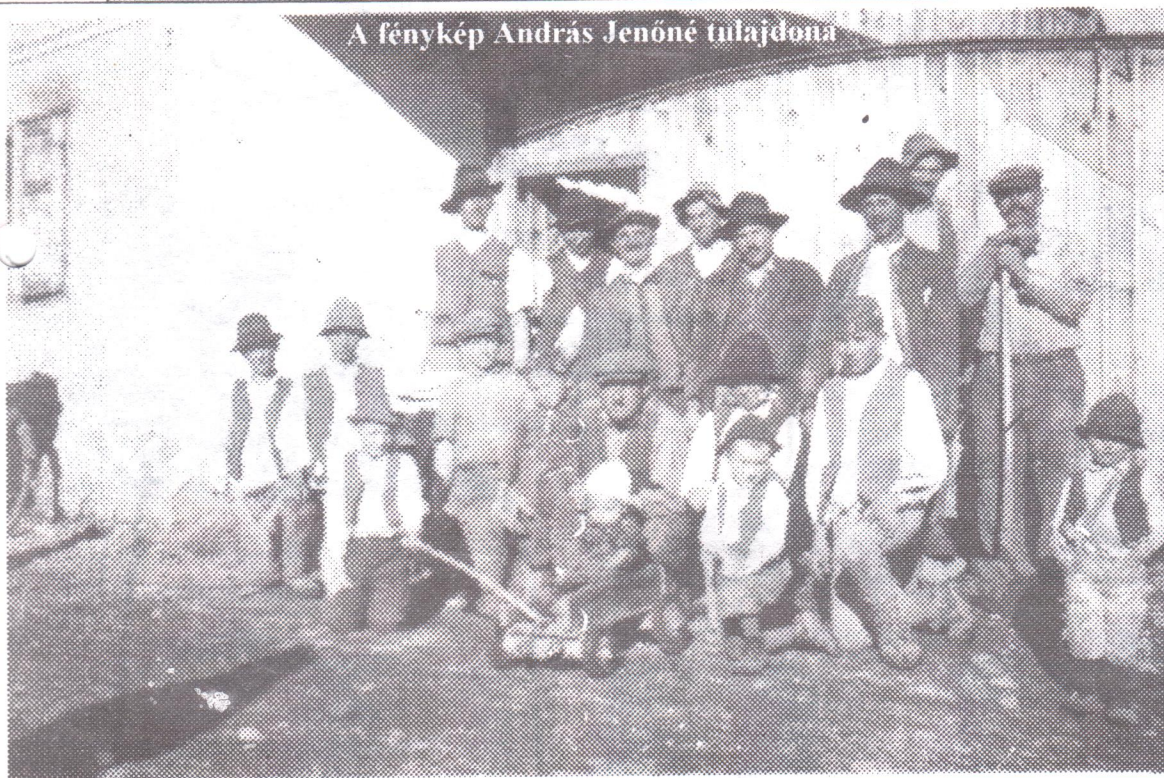
1941. október 15. Lövetei Közepszegi Malom résztulajdonosai a malomárok ásása alkalmával.