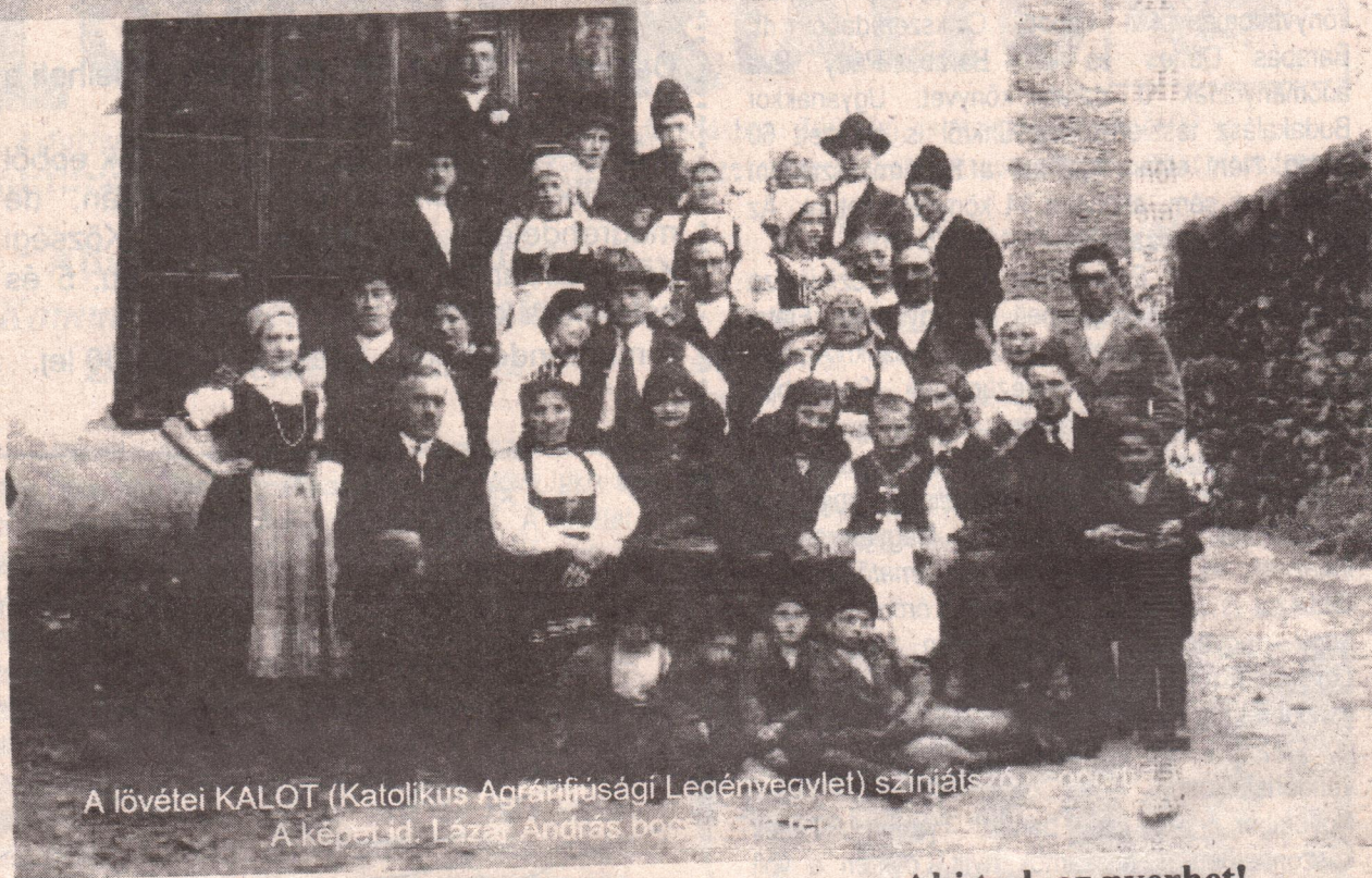
A lövétei KALOT (Katolikus Agráriusági Legényegylet) színiársztása 2001. november 14-én a községi könyvtárban.