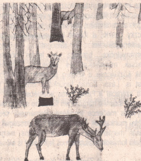
György Éva V. B rajza