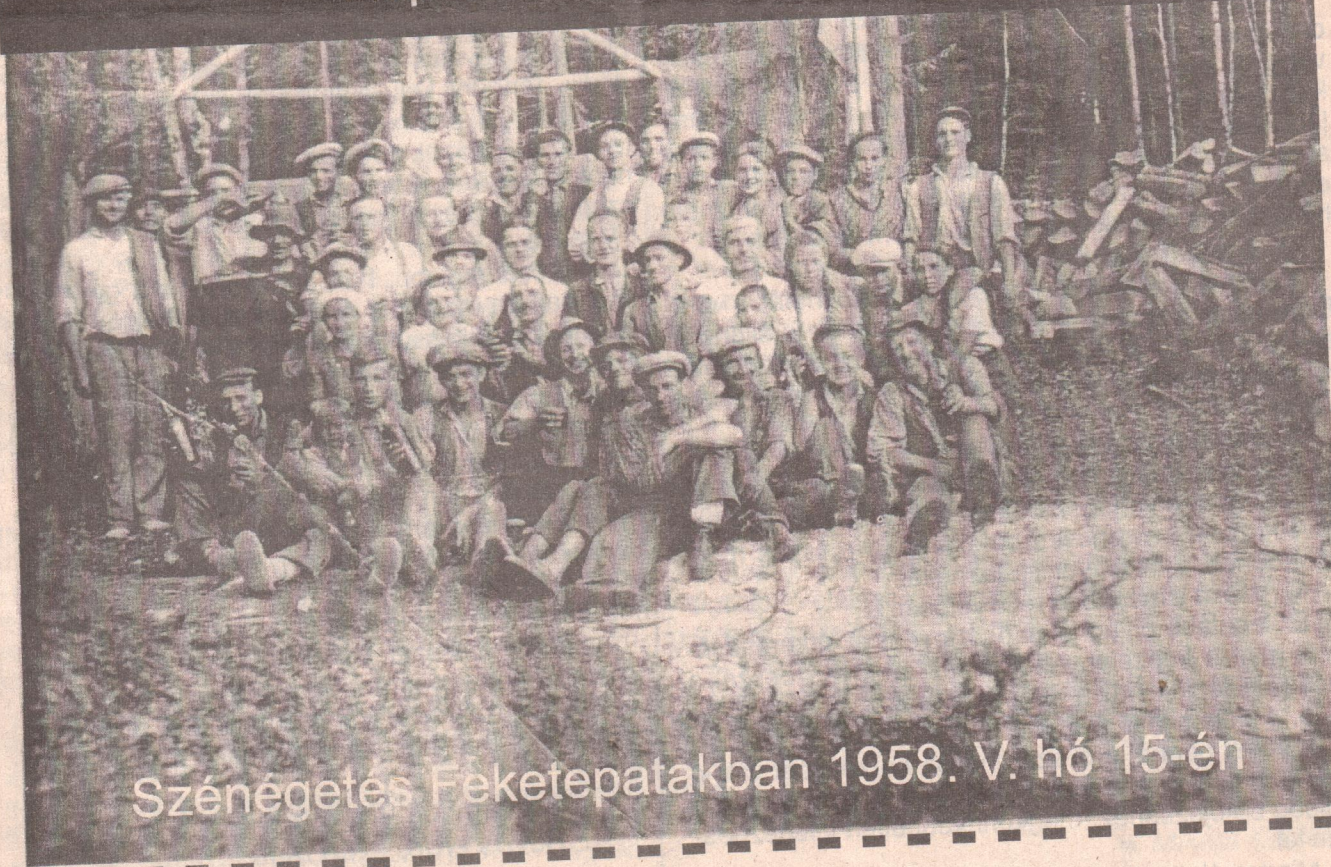
Szénégetés Feketepatakban 1958. V. hó 15-én