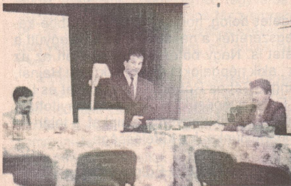
Kistérségi stratégiabemutató írásunk a 7. oldalon