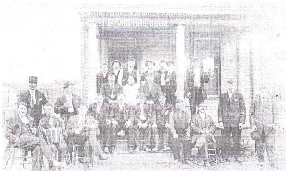
Képek Lövéte történetéből