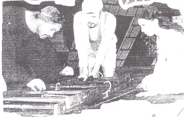
Csukás István mesejátéka két részben