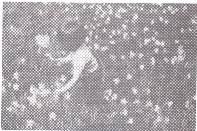
Egy a díjnyertes fotók közül

Április 22. világszerte a Föld napja. Mi is bekapcsolódunk e mozgalomba immár negyedik éve a Lovétei Ifjak Egyesülete által szervezett rendezvények által. Hogy mi is az üzenete a Föld napjának? Ezzel a nappal szeretnénk felhívni az emberek figyelmét a Föld védelmére és közvetlen környezetükre. A mi földünk Lovéte, erre kell vigyáznunk, és mi kell, hogy vigyázzunk rá, mert mi élünk itt. Magunknak és gyermekeinknek teszünk jót azzal, ha óvjuk és védjük a mi földünket. Mindenki felelősséget kell ébreszteni, hogy minden egyes lovétei érezze: tőle is függ a falu tisztasága és egészsége, neki is kötelessége vigyázni rá.