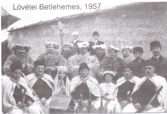
Lövétei Betlehemes, 1957

V. évfolyam, 12. szám, 2003. december. Ára szabadeladásban: 5000 lej