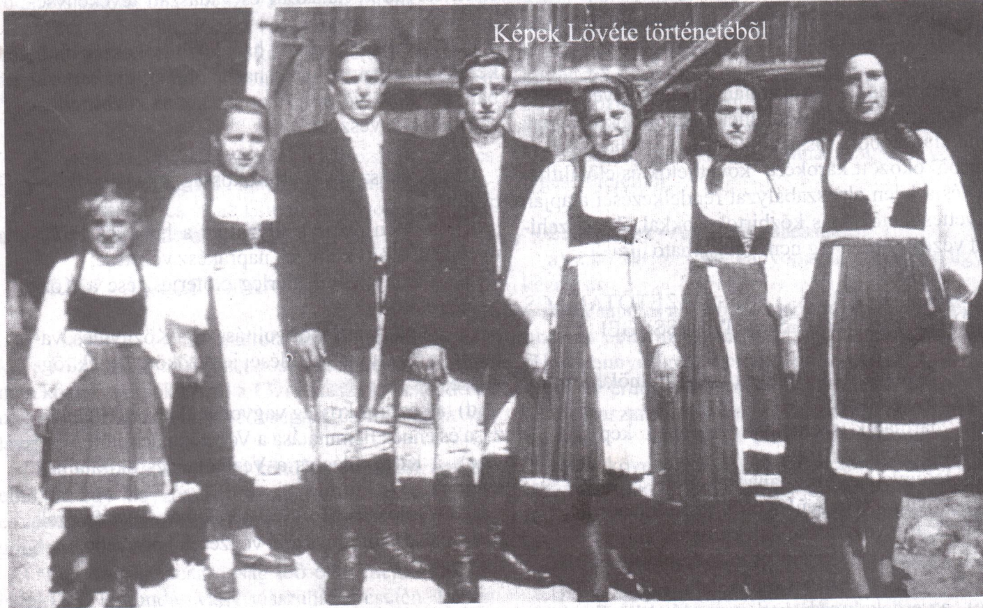
Képek Lövete történetéből

Kiadja a Lövetei Ifjak Egyesülete Nyomta a ROTAPRINT nyomda