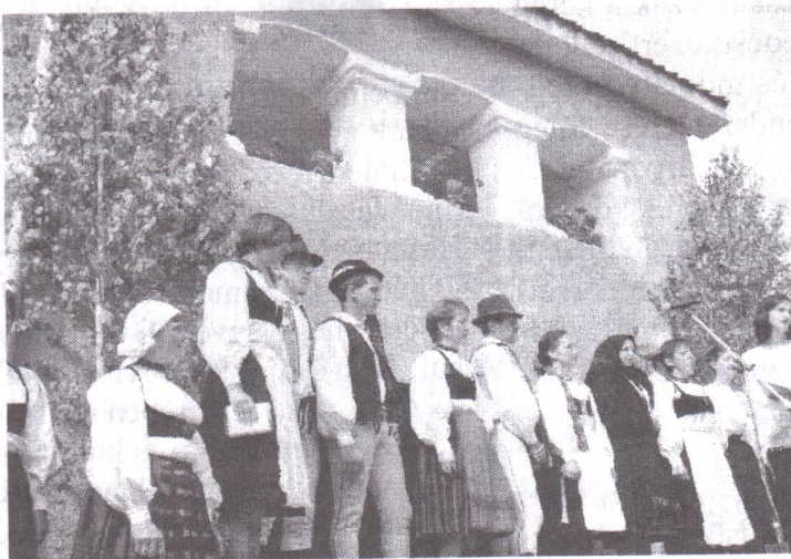
A felvétel a tájházavatón készült

- Mikor kerül sor a táncpróbákra, milyen gyakorisággal?