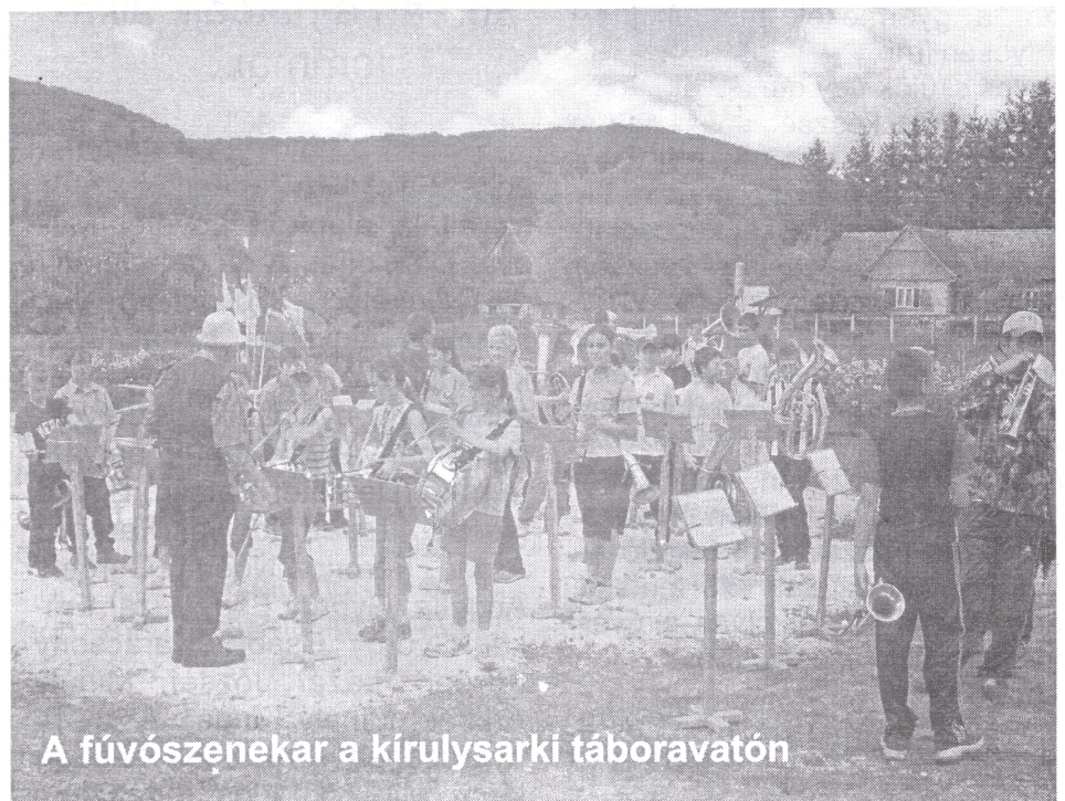
A fúvószenekar a kirulysarki táboravatón