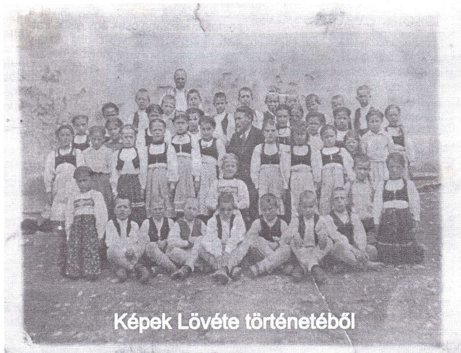
Képek Lővete történetéből

A lővetei római katolikus népiskola II. osztályosai az 1938-39-es tanévben.