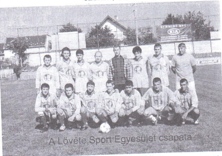
A Lövete Sport Egyesület csapata

Az esti fogadásra a nagyszámú lövetei vendégnek a szükséges ételt, italt az Erdélyi Kör tagjai, a Maglódi Öreg-fiúk csapata és Maglód polgármestere biztosította. Mindenki csodálatosan érezte magát. Hálásak vagyunk mind ezekért, és reméljük, hogy az el-