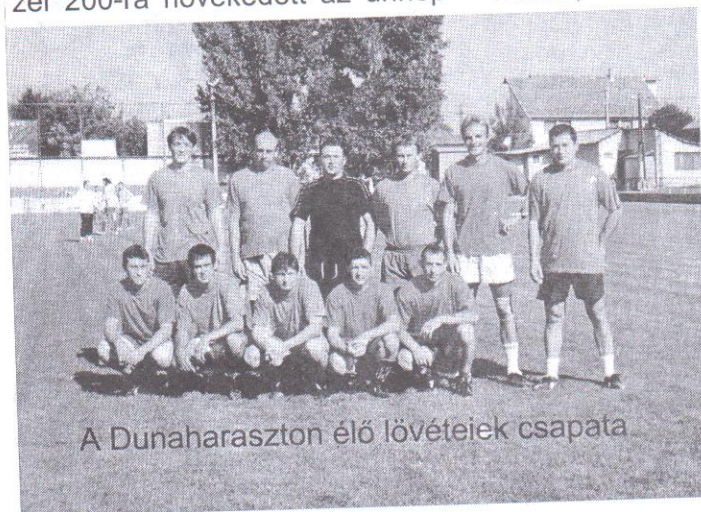
A Dunaharaszton élő löveteiek csapata

Estére az egész csapat Maglódra utazott az ünnepi előadásokra, tűzijátékokra és utcabálra, így közel 200-ra növekedett az ünnep-