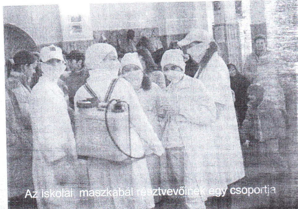
Az iskolai maszkabál résztvevőinek egy csoportja