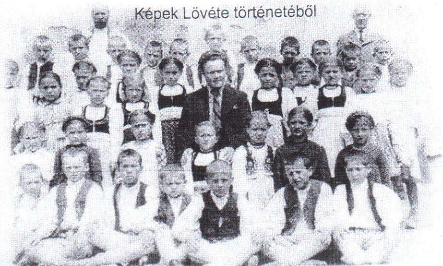
Képek Lövete történetéből

Megj. Az utóbbi két adat valószínűleg összekapcsolható (mj.)