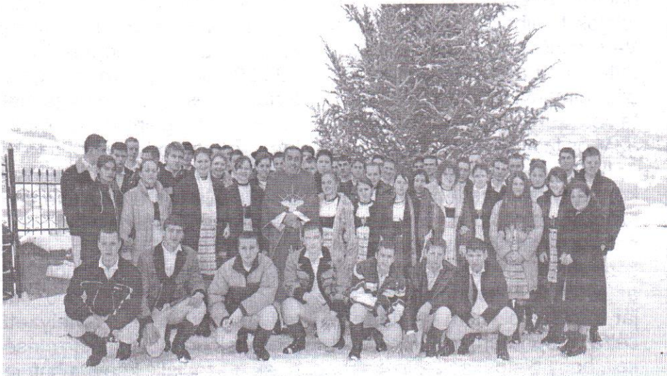
Az 1987-ben születettek a háladási szentmiséjük után

VIII. évfolyam, 1. szám, 2006. január. Ára szabadeladásban: 1 lej