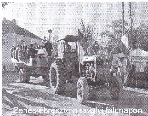
Zenés ébresztő a falvai falunapon

Vasárnap délután Isten segítségével régi álmunkat szeretnénk valóra váltani nagyon sok jóindulatú ember segítségével, vagyis hála Istennek ma is élő adatközlők visszaemlékezései és elmondásai alapján, lehetőségeink szerint minél hitelesebben szeretnénk szülőfalunk iránti tiszteletből, falustársaink iránti szeretetből bemutatni a régi lövétei lakodalmast, tisztelegve ezzel őseink gyönyörű viselete, énekei és hagyományai előtt. Tisztelettel meghívjuk falunk apraját-nagyját a lakodalomba, legyen ez a lakodalom a falu lakodalma, hiszen mindannyinkat székely anya szült, talpig székely volt az édesapánk, és székely érzés maradt róluk reánk is.