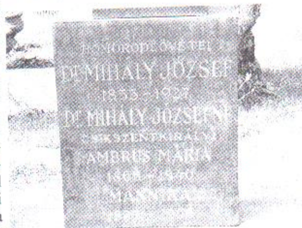
Dr. Mihály József sírja