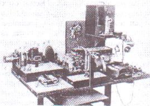
a televízió őse a telehor

A sikeres tudós magánélete, egyéni sorsa szomorú volt. Anyagi gondokkal küzdött. Magyarországon 1940. november 23-án járt utoljára, amikor édesanyja temetésére jött haza az óhazába. Ekkor közölte, hogy szeretne hazatérni, s ha egyetemi katedrát kap, akkor végleg itthon telepedik le. Sajnos a magyar kormányzat nem ismerte fel Mihály Dénes értékét. Visszatérve Berlinbe, Hitler uralma alatt koncentrációs táborba került, mert üldözötteket bújtatott. Házasága gyermektelen maradt, amit sohasem tudott feldolgozni. Élete végén betegen is, de dolgozott tovább. Süketnémák számára ábécé kidolgozásán munkálkodott. A táborban szerzett tuberkulózis okozta halálát 1953. augusztus 29-én, Nyugat-Berlinben. Emlékére a Pest megyei Diósdon a Rádió és Televízió Múzeumának épülete előtti parkban kopjafát állítottak.