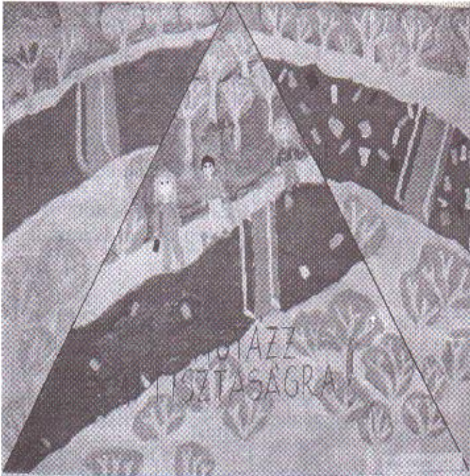
Föld napi rajzkiállítás - 2005; Mihály Tünde rajza

Ön - igen tisztelt szemetelő- április 22-én (vasárnap) hajnalban volt szíves a Kis-Homoródba önteni azt a szemetet, amelynek az elszállítása már rég megoldott. Ha nem tudta volna, falunkban rendszeresen hordják a szemetet, így az Ön szemetét is potom pénzért elszállítják, Önnek csak az a dolga, hogy a kijelölt gyűjtőhelyre vigye. Ami történetesen NEM A PATAK MEDRE !!! Valószínűnek tartom, hogy Ön is becsméri a Polgármesteri Hivatalt, a Helyi Tanácsot vagy a polgármestert, amiért szemetes a falu vagy a patak, holott éppen Ön az, aki fáradhatatlanul munkálkodik azon, hogy szemetben ne legyen hiány a közterületen és a patakban.