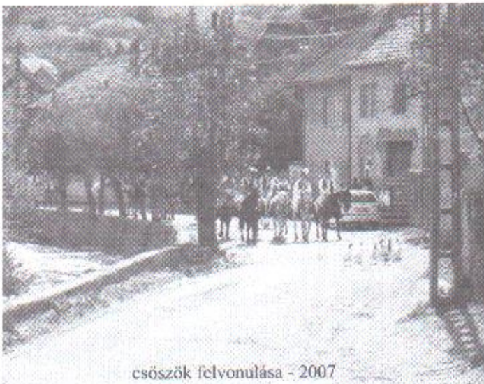
csöszök felvonulása - 2007