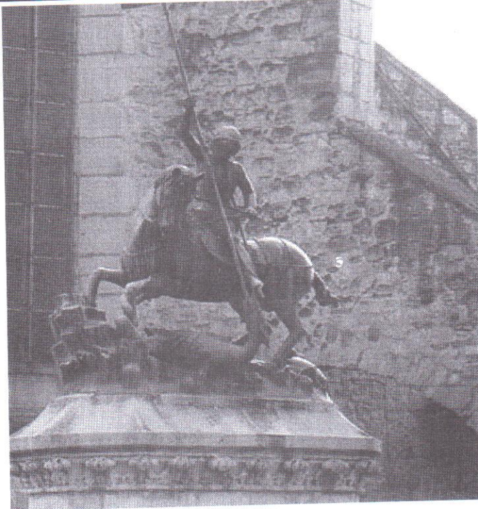
Sárkányölő Szent György (Kolozsvár)

Szent György sok legendás elemmel tarkított életében a sárkányviadal motívuma azt a keresztény meggyőződést fejezi ki, hogy a hit erejével bármit legyőzhetünk. Bízunk tehát, és reméljük, hiszen tavasz jő. Friss szelekkel, új gondolatokkal, új kihívásokkal.