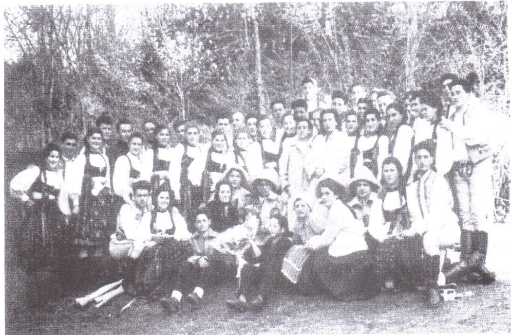
A Lövétei Bányavállalat egykori "agitációs brigádja", 1960-as évek