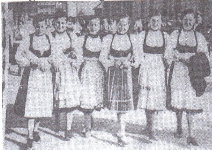
Brassóban szolgáló leányok, 1930-as évek