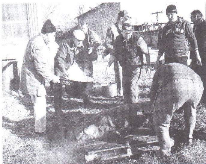
munkamegosztás a maglódi disznótoron