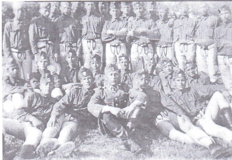
Leventék, 1940-es évek