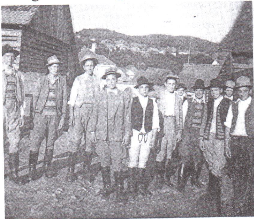
Lövétei legények, 1950-es évek.