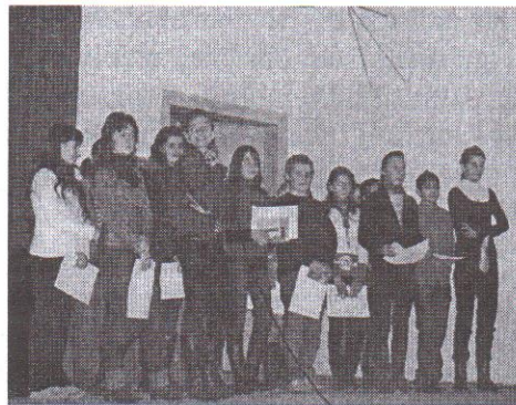
A Karaoke győztesei