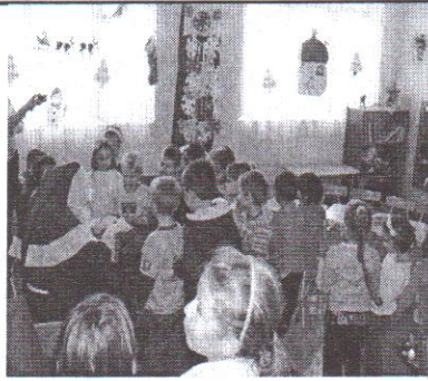
Mikulás az ovisoknál