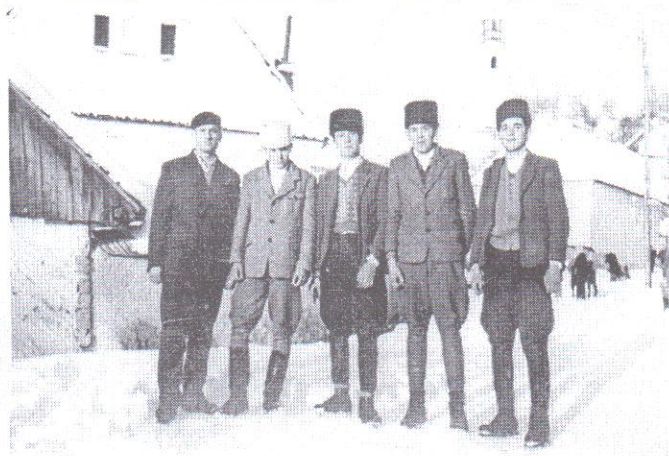
azok a 60-as évek ...