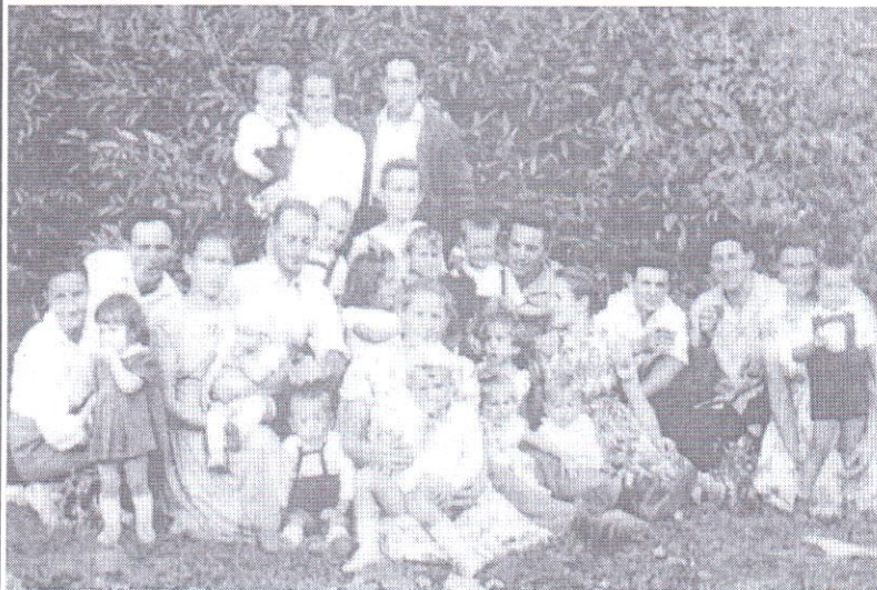
Vasárnap a Gerőkertben - 1969