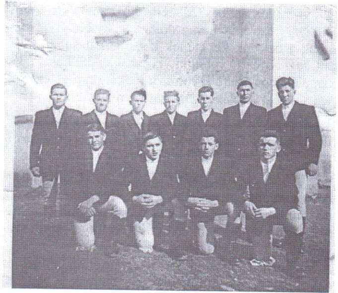
A Szent Sír őrző, 1939-ben született legények