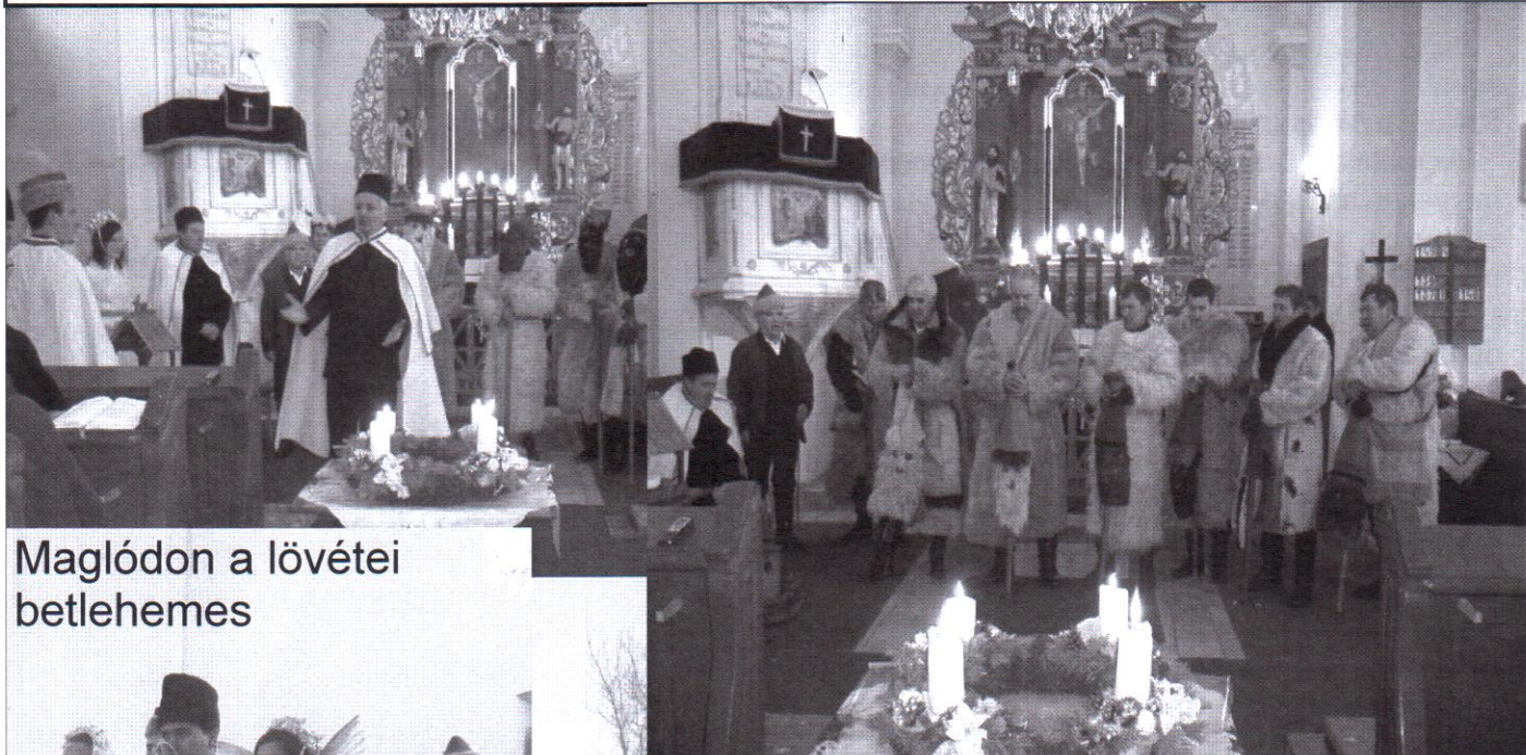
Maglódon a lövétei betlehemes