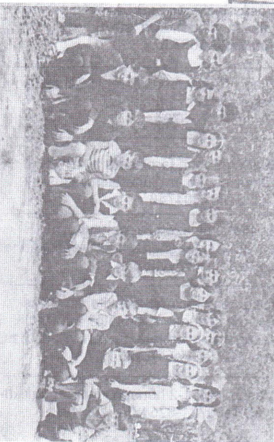
Osztályképek az 1969-70 ben ( felső 3 kép), illetve az 1960-ban ( alsó két kép) születettekkel.