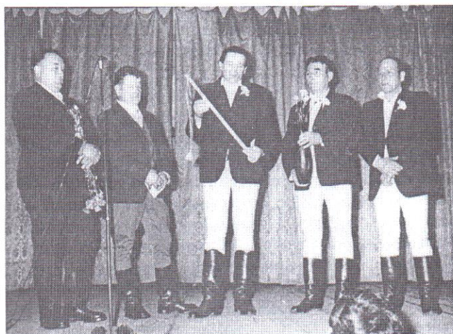
Az 1928-ban születettek útjára indítják az 50 éves zászlós-stafétát