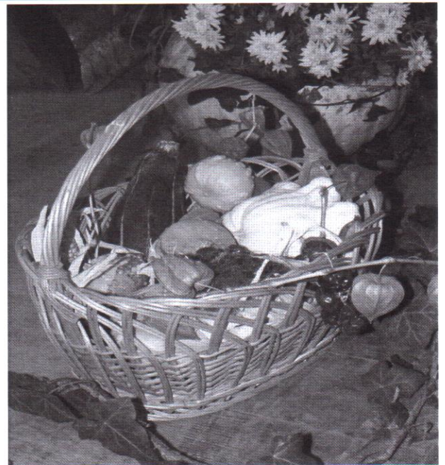
Lövétei pityókabálos díszlet