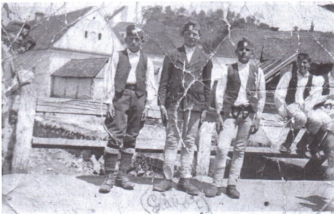
Lövétei "leventék" a Piachídon - kép a '40-es évekből