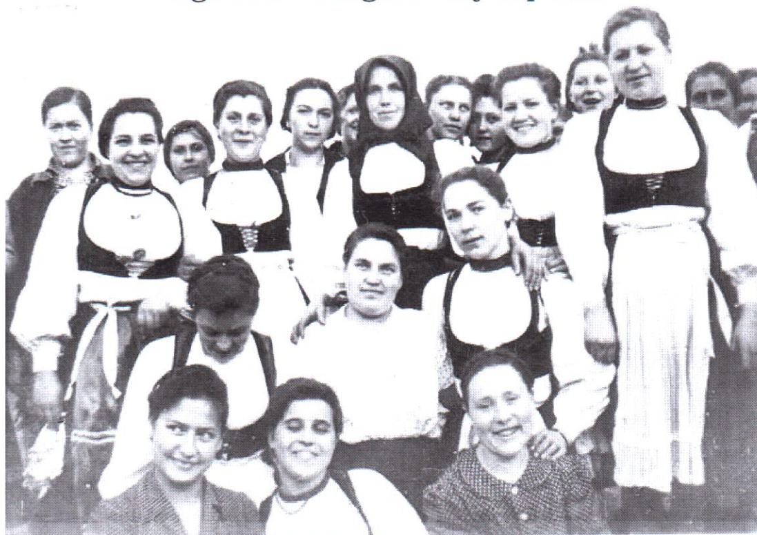
Lövétei szolgálólányok Budapesten 1943 - 1944.