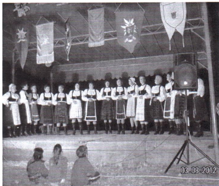
A lövétei asszonykórus augusztus elején az Erdélyi Kárpát Egyesület által szervezett vándortáborban szerepelt, sikerrel.