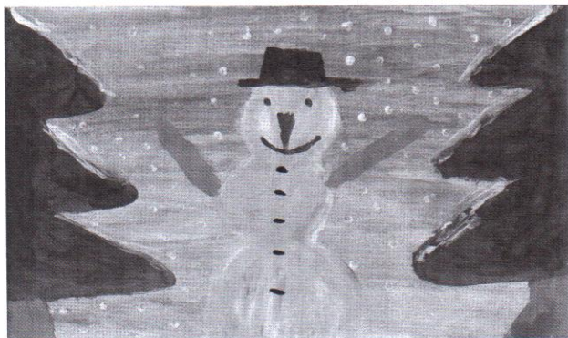
rajzolta György Norbert-András