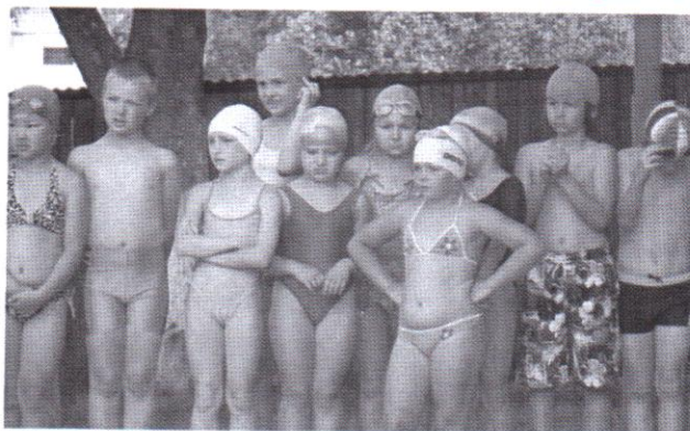
A lövétei úszócsapat "kicsimvei"