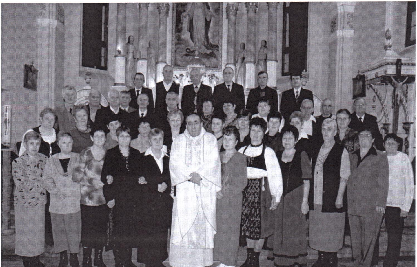
Lövete 60 éves találkozó 2013 Január 26