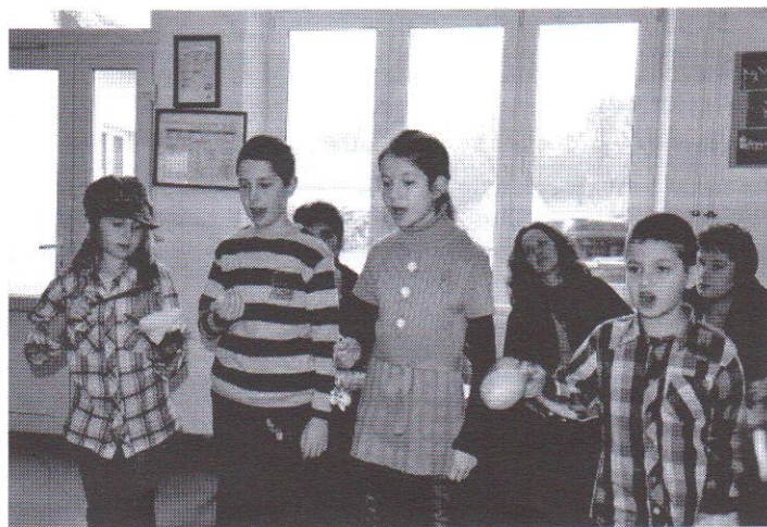
Senye-hegye csapat (I. helyezés)