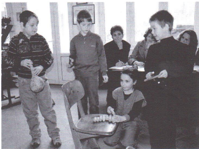
Kákvirág csapat (II. helyezés)