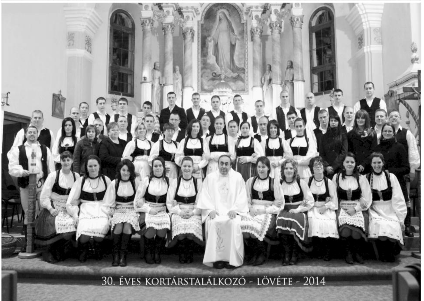
30. ÉVES KORTÁRSTALÁLKOZÓ - LÖVÉTE - 2014