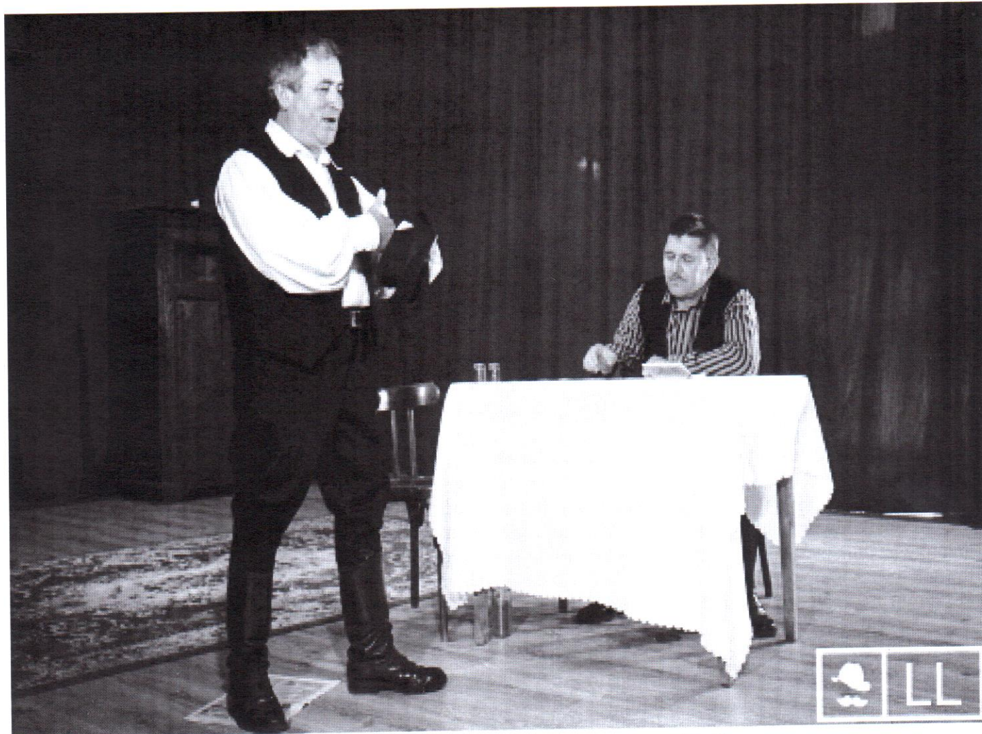
Pillanatkép a lövétei csoport produkciójából