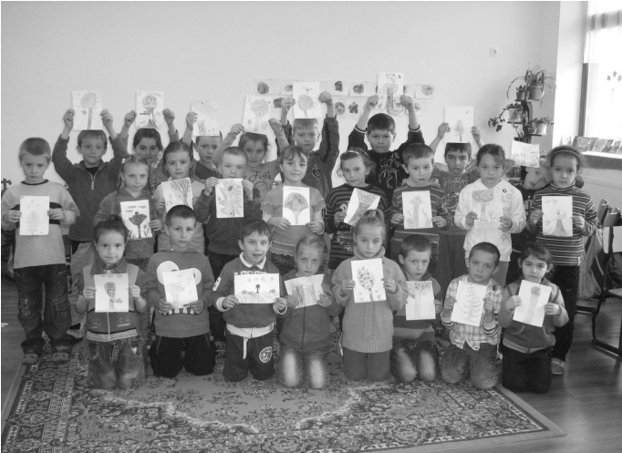
Nulladikos kisdíjakok a Föld Napi rajzversenyen