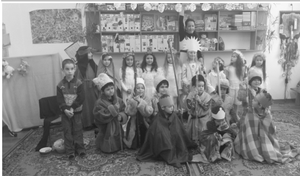
Kisiskolások betlehemes az iskolában