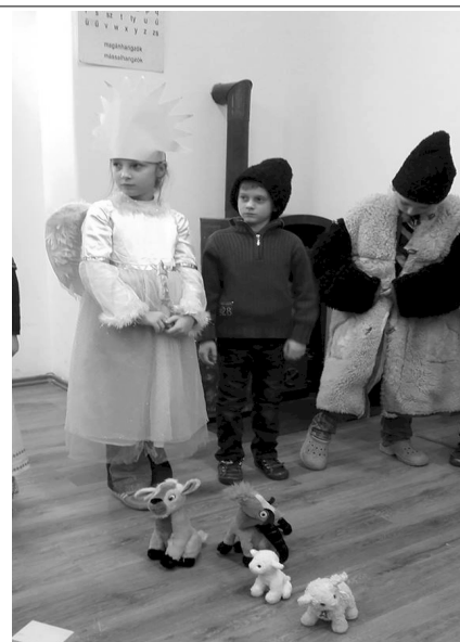
Másodikosok betlehemes a iskolában