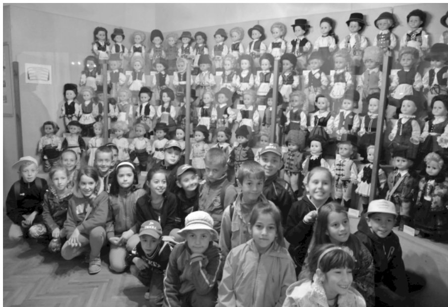
A II. osztályosok a Babamúzeumban