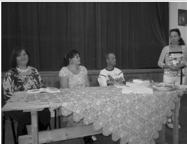
Pillanatkép az I. Székelyföldi Poet-találkozóról

Jutányos áron eladó fel nem használt sírkő. Telefon: 0266-220933