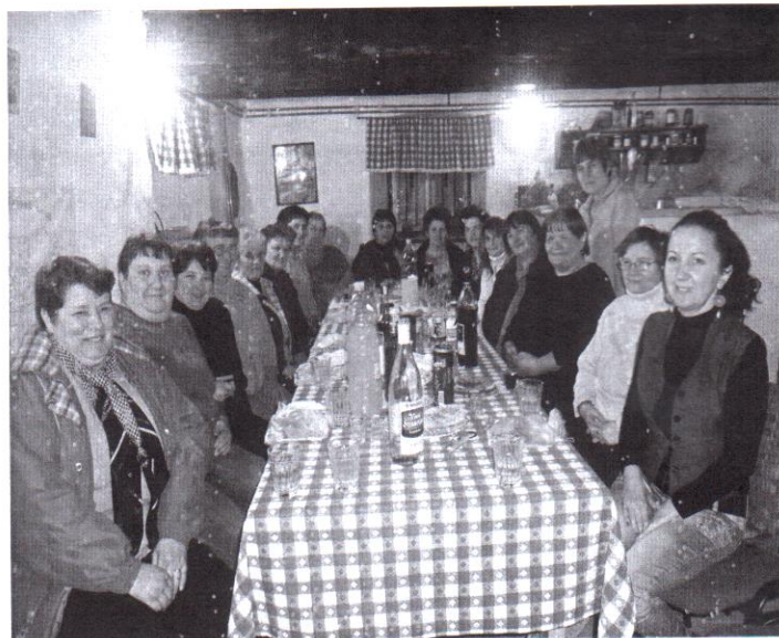
Nők Napja a lövétei Tájházban

Áldott húsvéti ünnepeket kíván minden kedves olvasójának a Lövétei Kiáltó szerkesztőség!