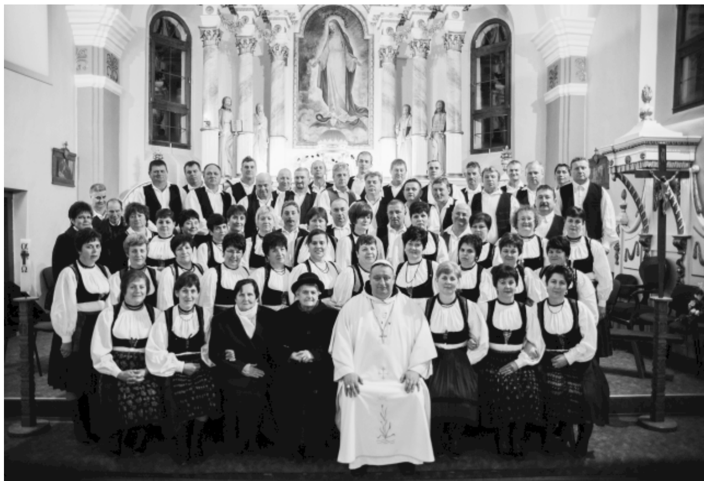
- 50 évesek -