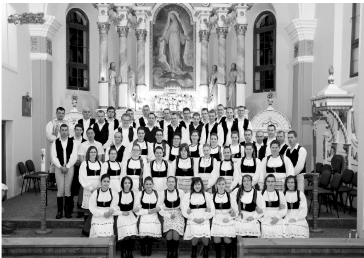
- 30 évesek -