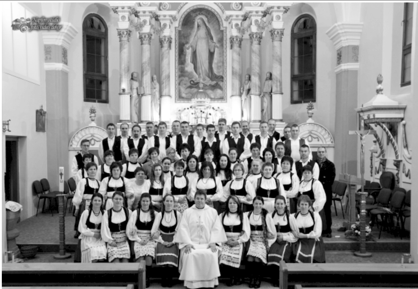
- 40 évesek -