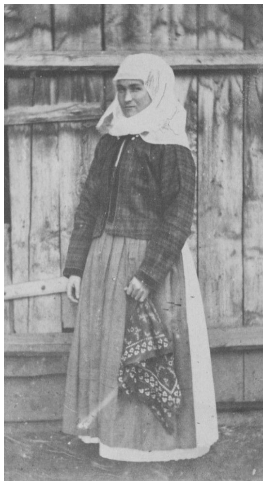
Lövétei menyecske fátyollal, 1868-ból