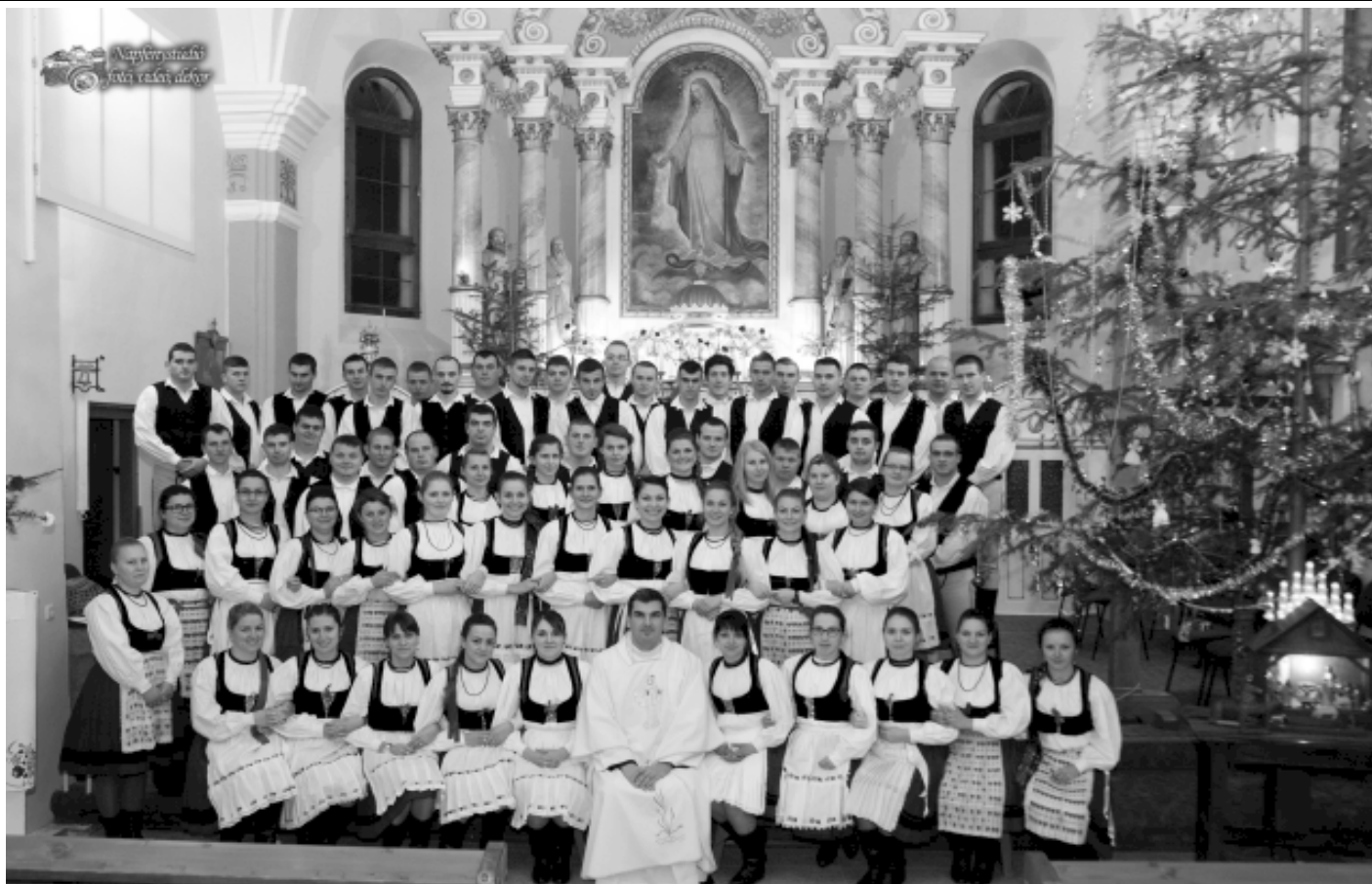
- 25 évesek -