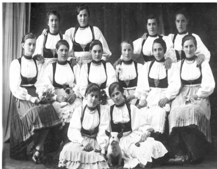
Lövétei leányok Brassóban. 1938.