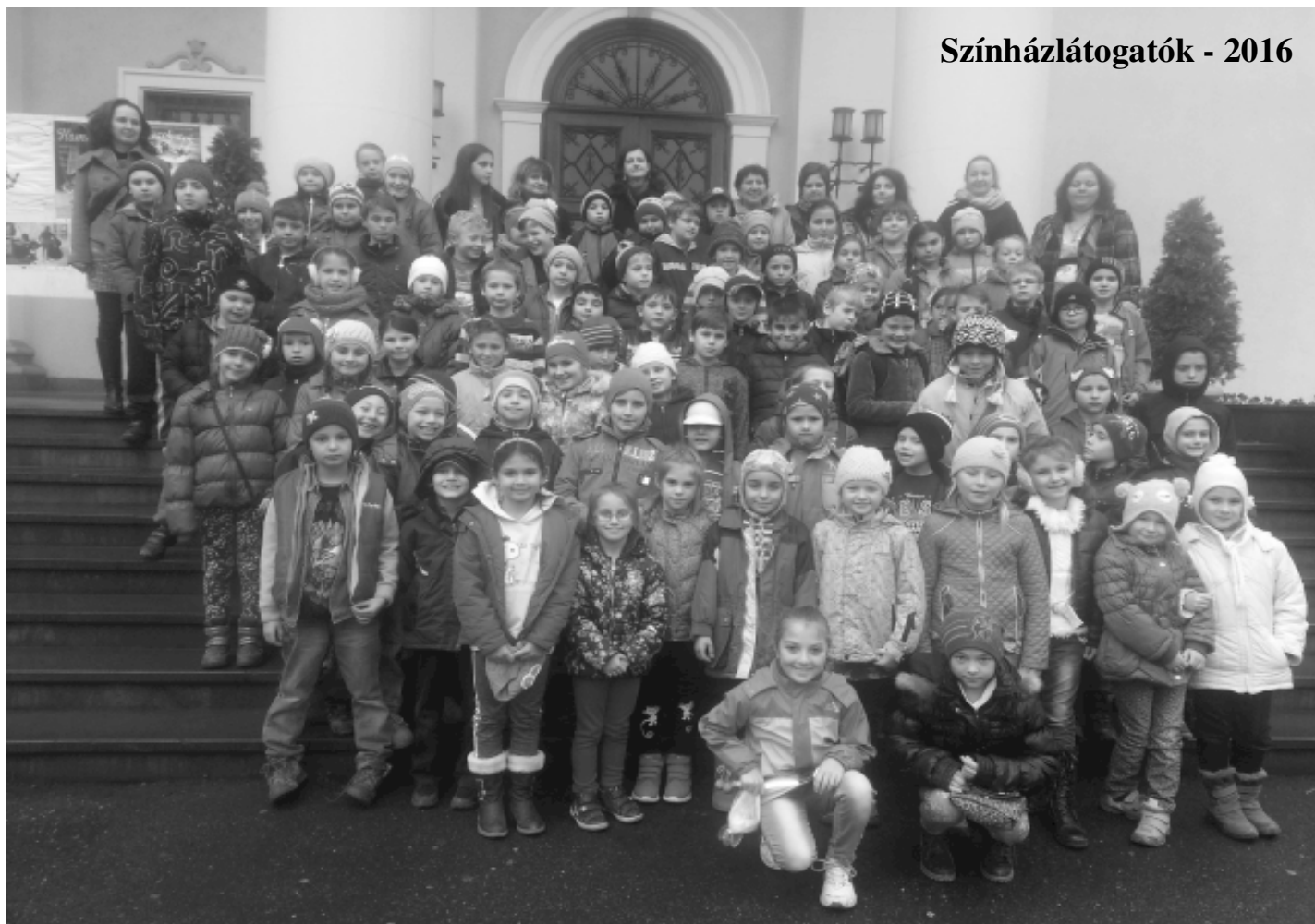
Színházlátogatók - 2016