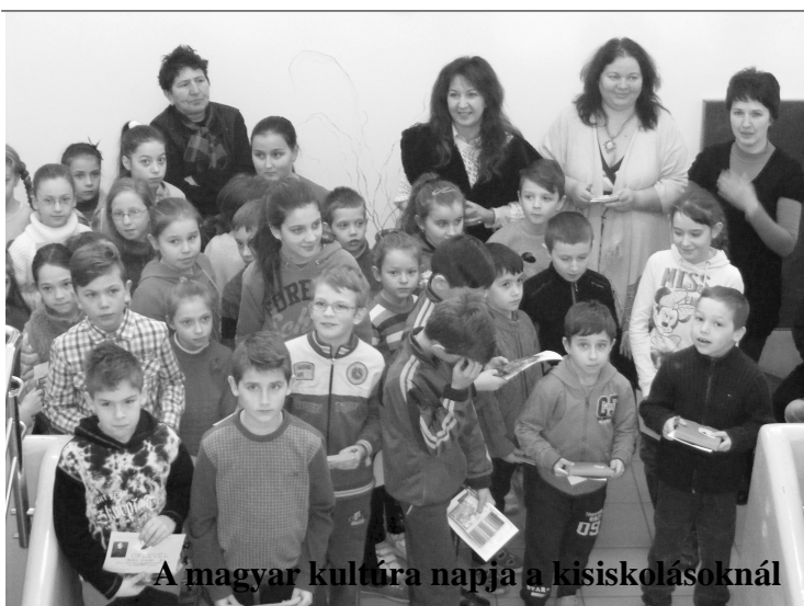
A magyar kultúra napja a kisiskolásoknál

Február 23. - Maszkabál Február 26. - Székelyruhás bál Február 25. - Nősemerbál Február 28. - Húshagyókedd