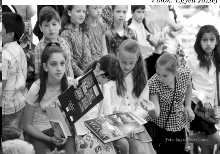
Fotó: Egyed József, 2017