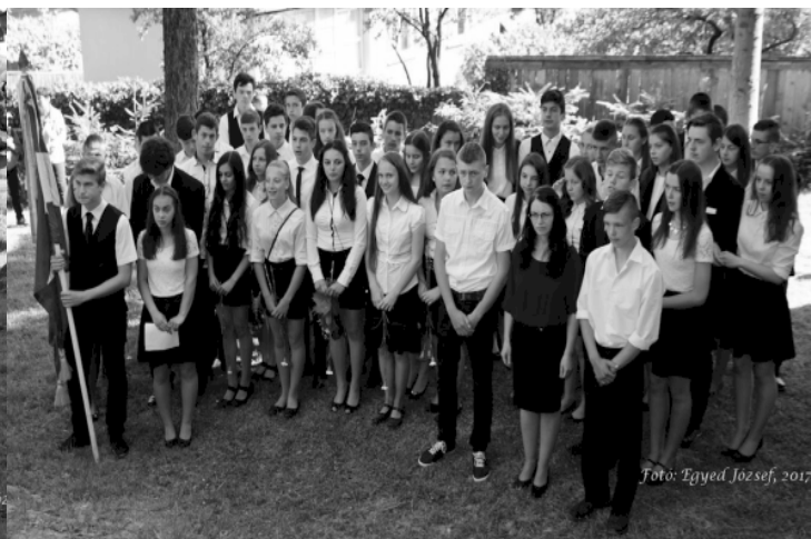
Fotó: Egyed József, 2017