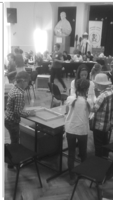
Munkában a Senye-hegye csapat