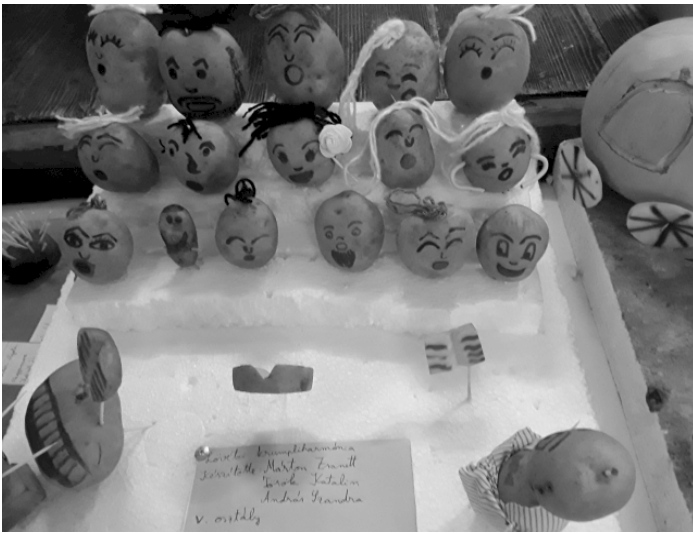
"Krumplikórus a pityókabálban"