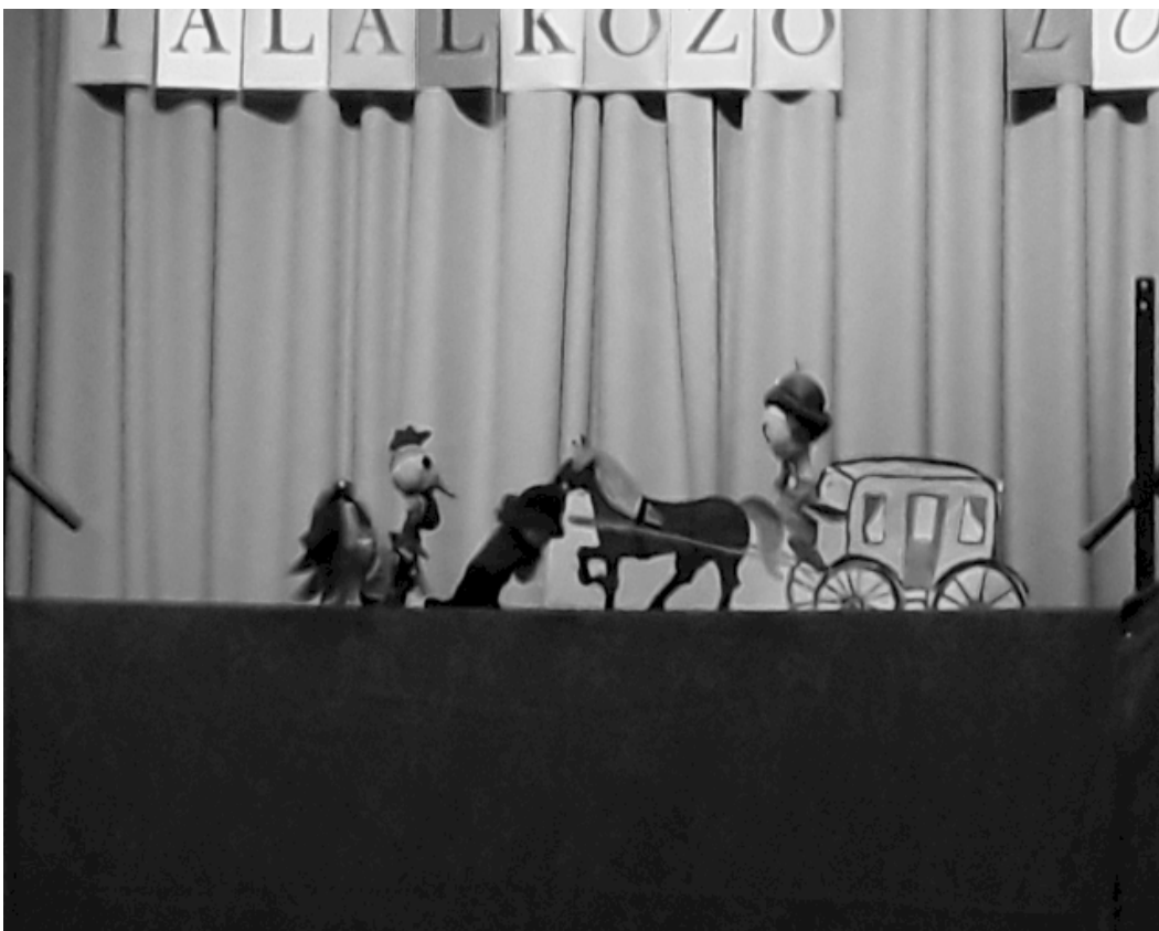
Részlet "A kiskakas gyémánt félkrajcárja" előadásából 📷