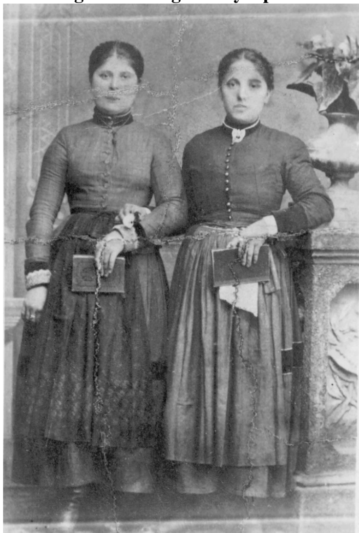
"Emlék Brassóból!" Lövetei leányok 1885-ben