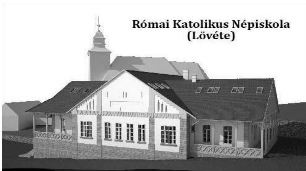
Római Katolikus Népiskola (Lövete)

Sajnos a helyi víztársulat az amúgy is kevés víz miatt nem tud vizet biztosítani, ezért az épület használata és üzembe helyezése nem lenne lehetséges abban az esetben sem, ha sikerülne azt berendezni. Kút fúrásával próbáltunk vízhez jutni, de sajnos magas a víz sótartalma, tönkretenné a vízcsövek és a fűtő berendezéseket, ezért ez a megoldás nem lehetséges. Esővízgyűjtő ciszterna telepítését javasolta a tervező, így legalább a WC-k, zuhanyzók használata megoldódna. A lövétei Közbirtokosság 2017-es 80000 lejes támogatási összegéből közös megegyezéssel szeretnénk a vízgyűjtő ciszterna telepítését megoldani, és az épületbe tervezett asztalok, székek egy részét elkészíttetni, ezúttal is köszönjük jó szándékukat, segítségüket.