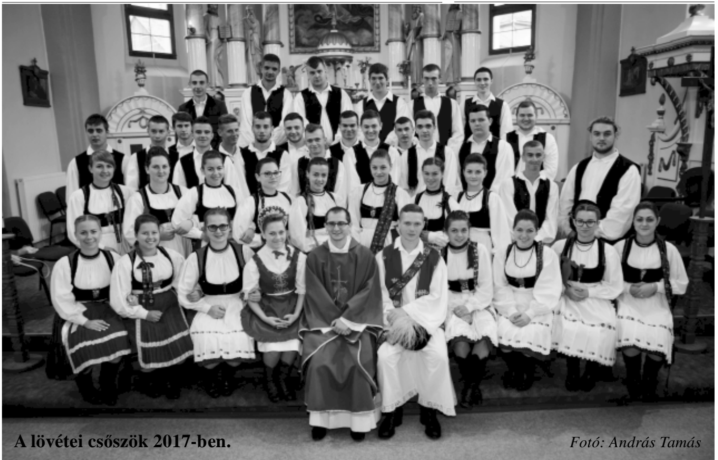
A lövétei csószók 2017-ben.